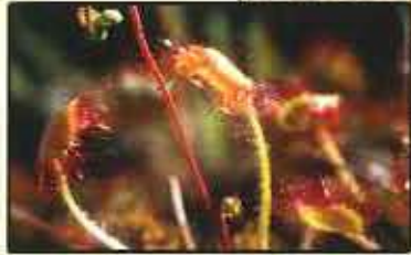
Rossolis à feuilles ronde ( Drosera Rotundifolia )