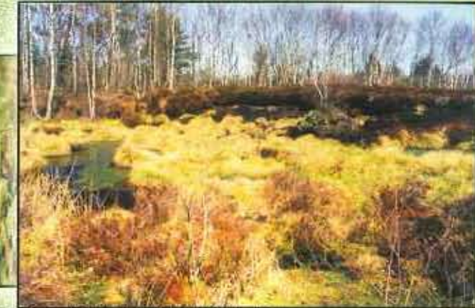
Eaux oligotrophes et tourbière boisée Tourbière de la Font Blanche