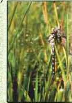
Aeshne bleue ( Aeshna cyanea )