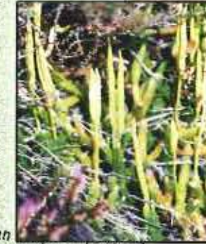
Lycopode en Massue ( Lycopodium clavatum )