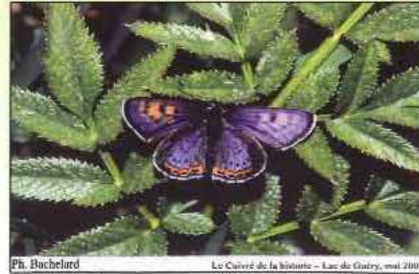
Le Cuivré de la bistorte - Lac de Guiry, mai 2004

Espérons que la population des Monts de la Madeleine se portera aussi bien que par le passé !