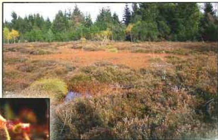
Tourbière haute active et dépression sur substrat tourbeux. Tourbière des Narces.