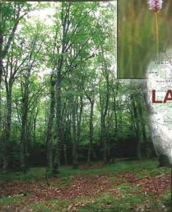
Hêtraie acidiphile atlantique à houx. Forêt domaniale de l'Assise