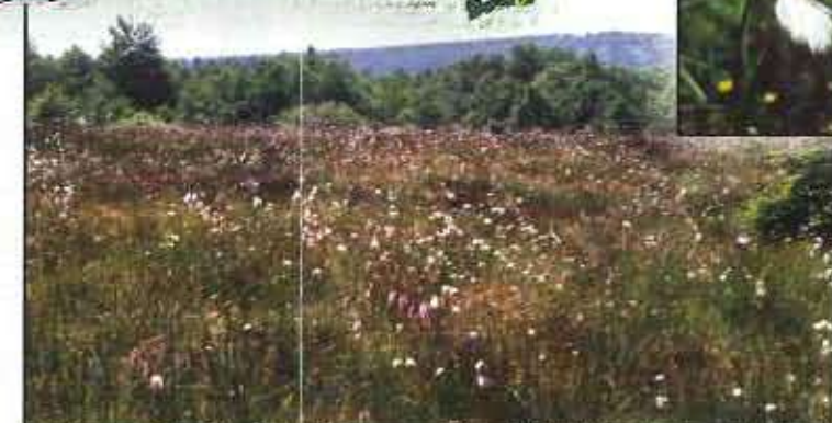
Prairies humides à Molinie et à jonc acutiflore. Habitat du Damier de la Succise et du Cuvré de la Bistorte (sous espèce Magdalénae)