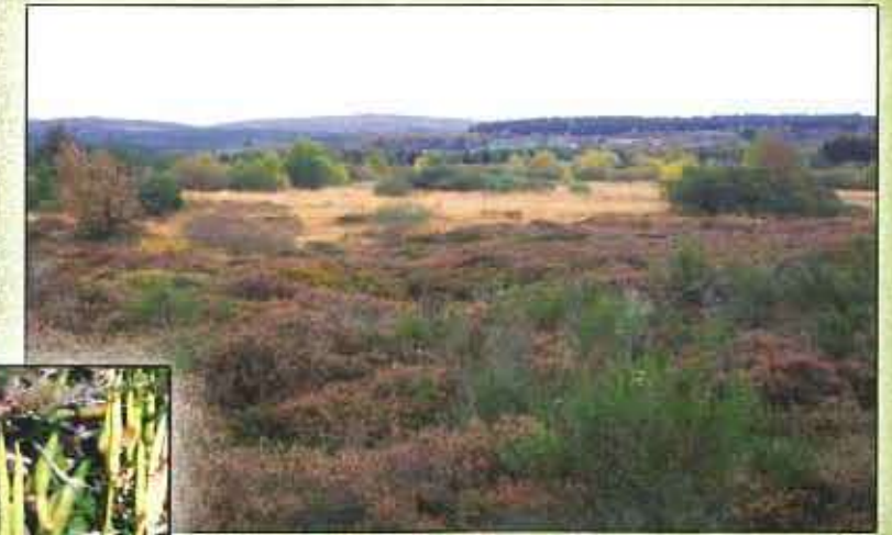
Landes sèches européennes et prairies humides à Molinie au fond Tourbière de la Verrerie