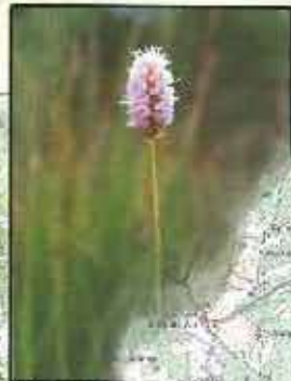
Renouée Bistorte ( Polygonum bistorta )