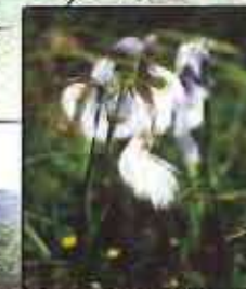
Lilygrette à feuilles étroites ( Eriophorum angustifolium )