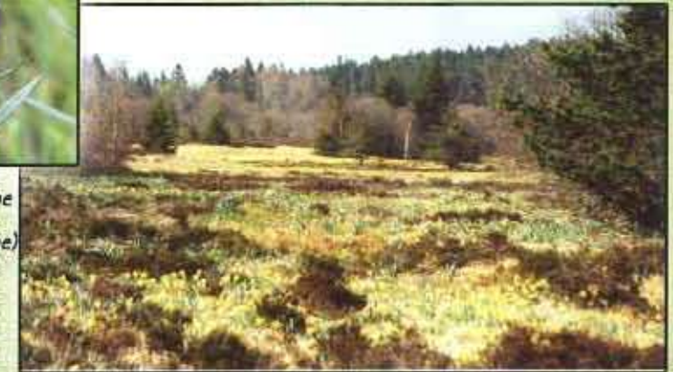
Tourbière de transition et tremblants, Tourbière boisée au loin et prairies humides à Molinie. Cette tourbière est l'une des plus anciennes du massif. Elle est bien préservée grâce à l'intérêt de ses propriétaires. Tourbière du Gué de la Chaix