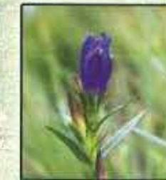
Gentiane Pneumonanthe ( Gentiana pneumonanthe )